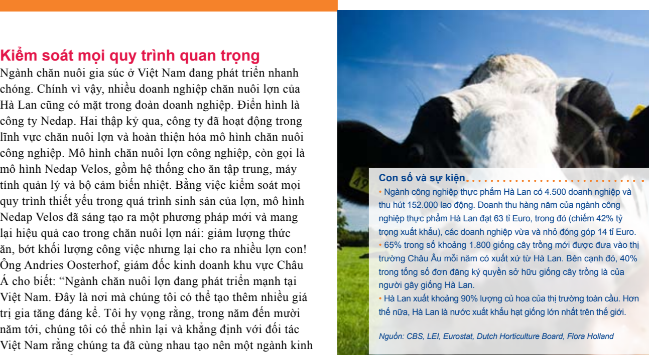
Nguồn: Energising the Future

Chuyến thăm Việt Nam lần này gồm nhiều doanh nghiệp vừa và nhỏ hoạt động trong ngành nông sản và thực phẩm Hà Lan. Điển hình là Geerlofs – doanh nghiệp đã hoạt động tại Việt Nam – là doanh nghiệp tiên tiến đang nắm giữ một thị phần riêng trong lĩnh vực làm lạnh. Công ty Geerlofs đã hoạt động được 75 năm. Năm ở miền Tây Hà Lan, nơi tập trung đông các trang trại nhà kính, doanh nghiệp lạnh lạnh Geerlofs đã trực tiếp tham gia thiết kế và phát triển chuỗi cung ứng sản phẩm của ngành nông sản, trồng trọt và chế biến thực phẩm cho thị trường trong và ngoài nước. Tại Việt Nam,Geerlofs cũng cung cấp các máy làm lạnh trồng hoa hồng và hoa cúc cho công ty TNHH Agrivina, Đà Lat Hasfarm. Doanh nghiệp cũng cung cấp kho lạnh bảo quản khoai tây. Điểm mạnh của Geerlofs là những công trình làm lạnh tron gói, chia khoai cho tạo đảm bảo công nghệ tiên tiến của Hà Lan được sản xuất tại Trung Quốc với giá thành hợp lý. Dự án xây dựng Trung tâm xử lý hàng hóa để hư hỏng Coolport tại trung tâm sân bay Changi, Singapore với sức chứa 50.000 mét khối hàng hóa, đã đưa tên tuổi của công ty đến với các nước Châu Á. Công trình này giúp bảo quản và vận chuyển khối lượng lớn hàng hóa để hư hỏng qua một trong những sân bay hiện đại và nhộn nhịp bậc nhất thế giới.